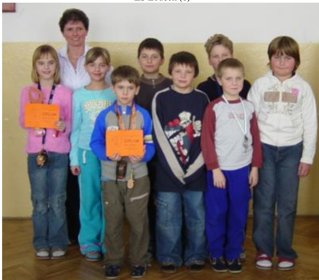
ZŠ G.A.Lindnera Rožďalovice (8)