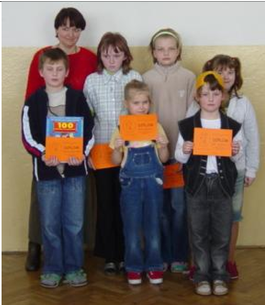
ZŠ Dětenice (6)