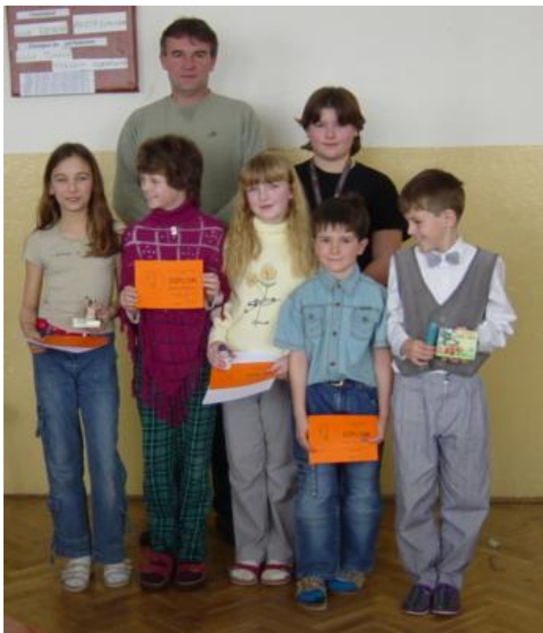
ZŠ Loučeň (6)