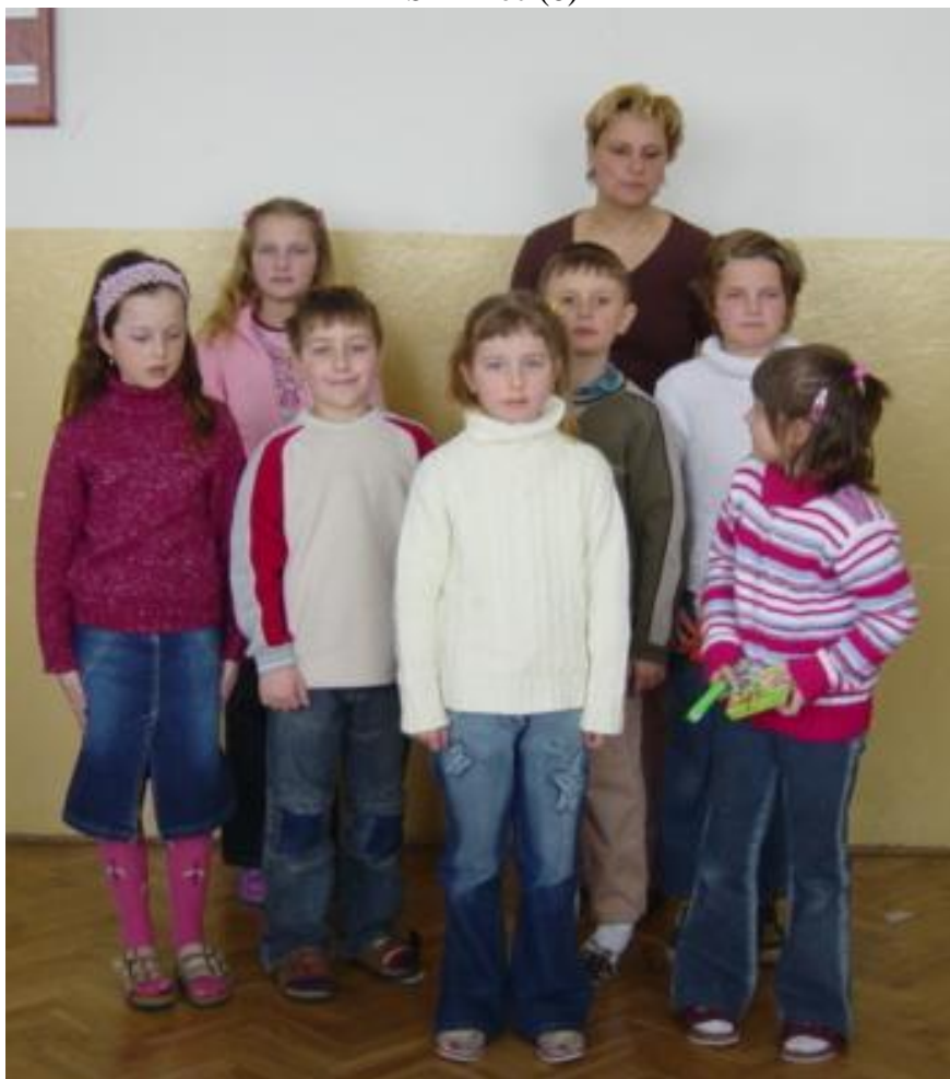
ZŠ Libáň (7)