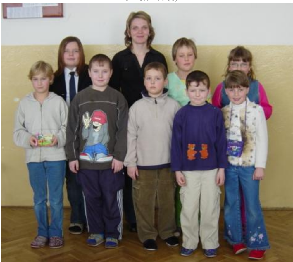
Masarykova ZŠ Dymokury (8)