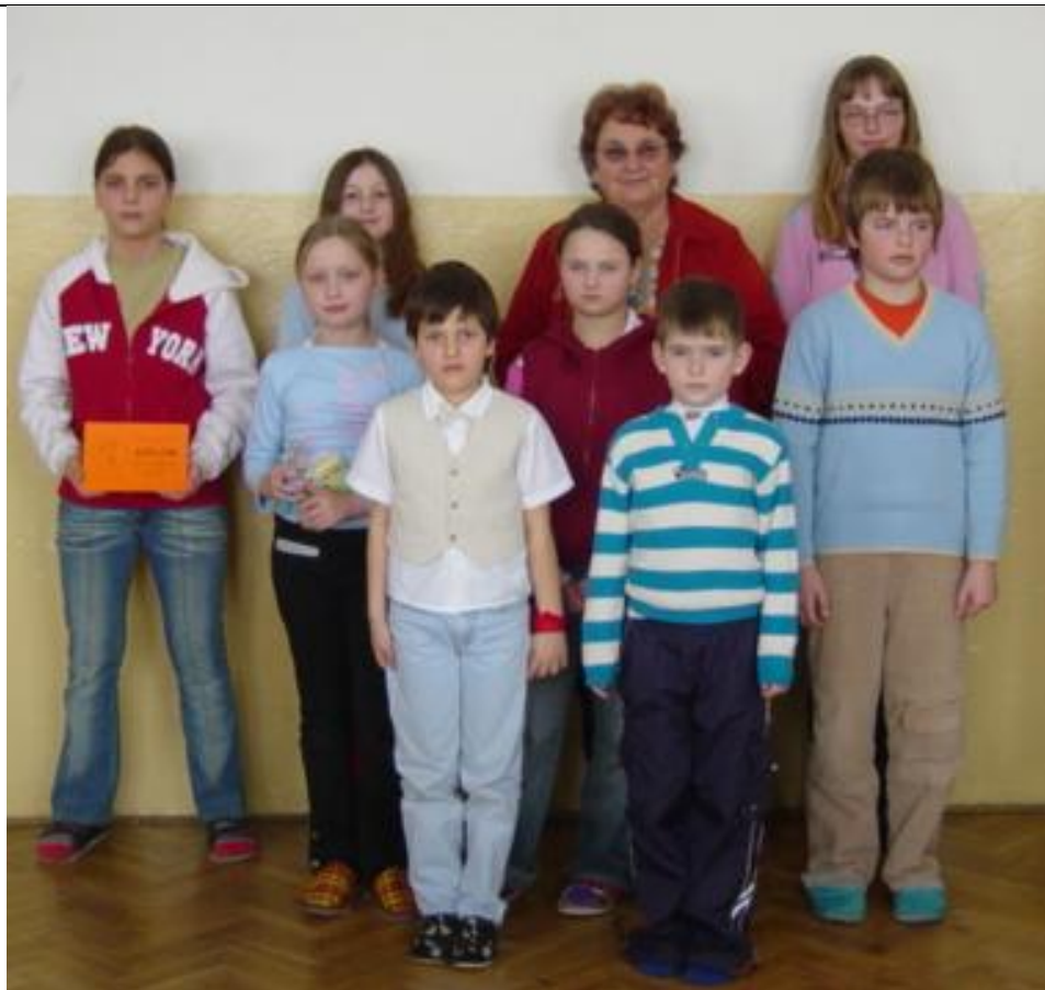
ZŠ Křinec (8)